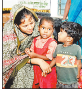
निरीक्षण करती मंत्री।

उत्पादन, बच्चों के पोषण पर विशेष ध्यान देने का निर्देश दिया। साथ ही राजवाड़े ने मातृ वंदना योजना से निरंतर निरीक्षण करने और