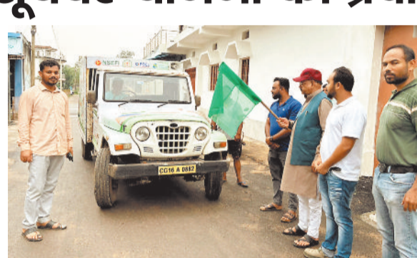
माध्यम से आने वाले दिनों में बैकुण्ठपुर शहर के प्रत्येक मोहल्ले और वाडें तक योजना की जानकारी पहुंचाई जाएगी। इस रथ की खासियत यह है कि यह न केवल योजना की जानकारी देगा बल्कि