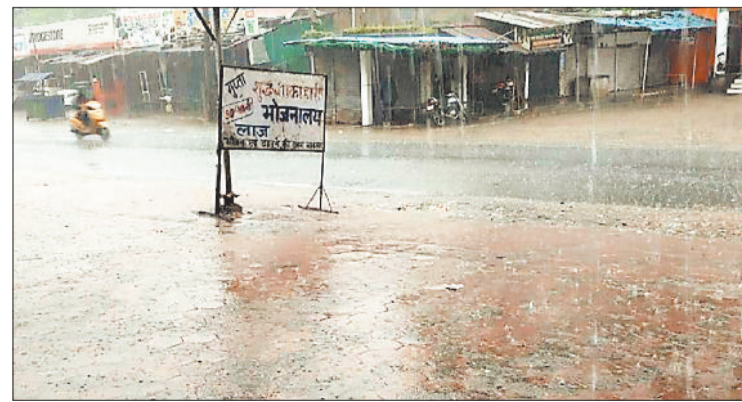
हो रही बारिश सड़क पर भरा पानी।

कोरिया जिला मुख्यालय बैकुंठपुर सहित जिले के कई क्षेत्रों में सोमवार की सुबह से ही बारिश शुरू हुई तो घंटों झमाझम बरसता रहा। आश्विन माह में ऐसी बारिश हुई मानों सावन माह की झड़ी लग गई हो। जानकारी के अनुसार 15 सितंबर की सुबह करीब 6 बजे से शहर व आस-पास तथा जिले के कई क्षेत्रों में झमाझम बारिश शुरू हुई और करीब चार घंटे तक बिना गरज के बادل बरसते रहे। चार घंटे की बारिश से पूरा शहर तर-बतर हो गया। सड़क किनारे नालियों से उपर पानी का बहाव होते हुए सड़क पर कई जगहों पर भर गया, इसके चलते लोगों को आवागमन में परेशानी हुई। इस दिन सुबह 6 बजे से शुरू हुई बारिश की गति 10 बजे के