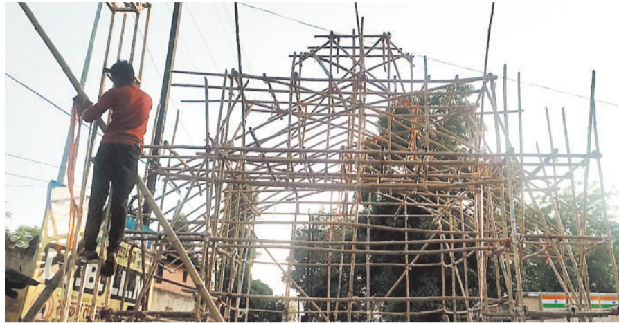
तैयार हो रहा पंडाल।

नवरात्रि और दशहरा पर्व को देखते हुए स्थानीय प्रशासन व पुलिस विभाग ने भी विशेष तैयारियां शुरू कर दी हैं। भीड़-भाड़ वाले स्थानों पर अतिरिक्त पुलिस बल की तैनाती होगी, वहीं यातायात व्यवस्था को दुरुस्त रखने के लिए ट्रैफिक पुलिस की टीम लगाई जाएगी। नगर पालिका द्वारा पंडालों के आसपास सफाई, पेयजल व प्रकाश व्यवस्था सुनिश्चित करने के निर्देश दिए गए हैं। भक्तजन पूरे उत्साह के साथ पर्व की तैयारी में जुटे हुए हैं और नगर का वातावरण धार्मिक उल्लास से सरबोरे हो गया है।