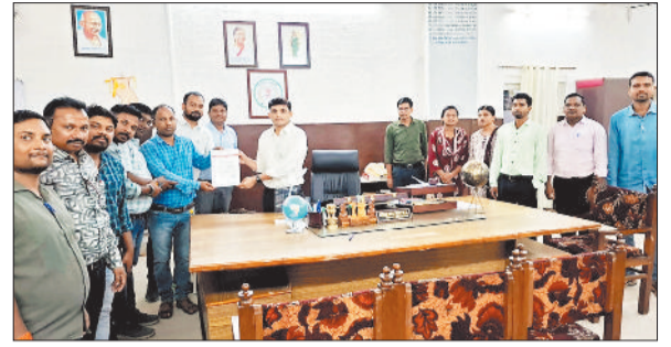
एसडीएम को ज्ञापन सौंपते संघ के लोग।